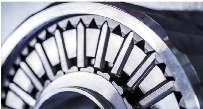
Galaxie-Getriebe [Wittenstein SE]

Eine bewährte Möglichkeit, die Effizienz von elektrischen Antriebssystemen zu steigern, stellt die Beschichtung von Motorkomponenten mittels Physical Vapor Deposition (PVD) dar. Zur Unterstützung der Verkehrswende wurden am IOT daher (Cr,Al,X)N-Beschichtungen (X = Mo, Cu) entwickelt. Diese wechselwirken unter tribologischer Beanspruchung mit Schmierstoffen bzw. Schmierstoffadditiven, was Reibungs- und Verschleißreduktionen ermöglicht. Um die Bauraumverkleinerung zu unterstützen, müssen diese Beschichtungen weiterentwickelt werden.